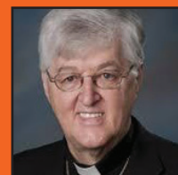
Mgr Noël Simard, évêque catholique de Valleyfield, au Québec