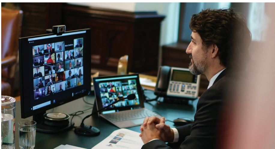
Le très hon. Justin Trudeau, premier ministre du Canada, en conversation avec des leaders religieux importants au sujet de la contribution positive de la foi en période de pandémie (3 décembre 2020;) | Rt. Hon. Justin Trudeau, Prime Minister of Canada, in conversation with prominent faith leaders about the positive contribution of faith in a time of pandemic (Dec 3, 2020;).