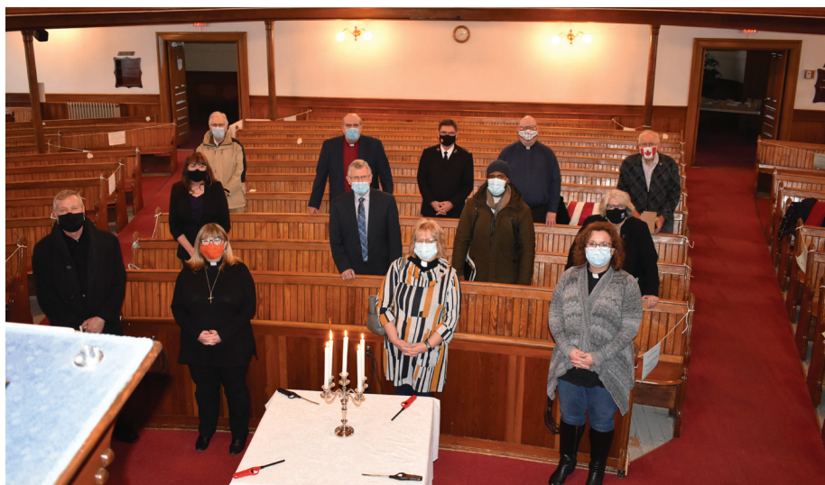
Denominational Leaders and Executive Members of the St. John’s and Area Council of Churches (St John’s, NL) gather to prepare a video of 2021 WPCU service to share with local congregations. | Les leaders des confessions et les membres du bureau de direction du Conseil des Églises de St. John’s et de la région (St. John’s, T.-N.) se rassemblent pour préparer une vidéo du service de la SPUC 2021 pour communiquer à leurs assemblées locales.