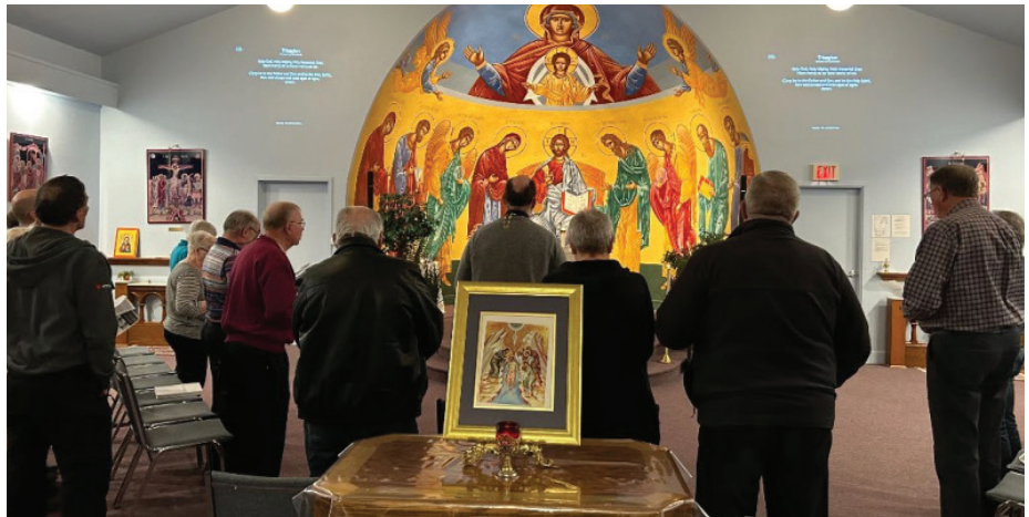
For the first time since the pandemic, the United, Anglican, Evangelical Orthodox, and Presbyterian churches in Saskatoon participated in their Week of Prayer tradition of morning prayer services and breakfast. | Pour la première fois depuis la pandémie, les églises unie, anglicane, orthodoxe, évangélique et presbytérienne de Saskatoon ont repris la tradition de leur prière du matin / petit déjeuner pendant la Semaine de prière.