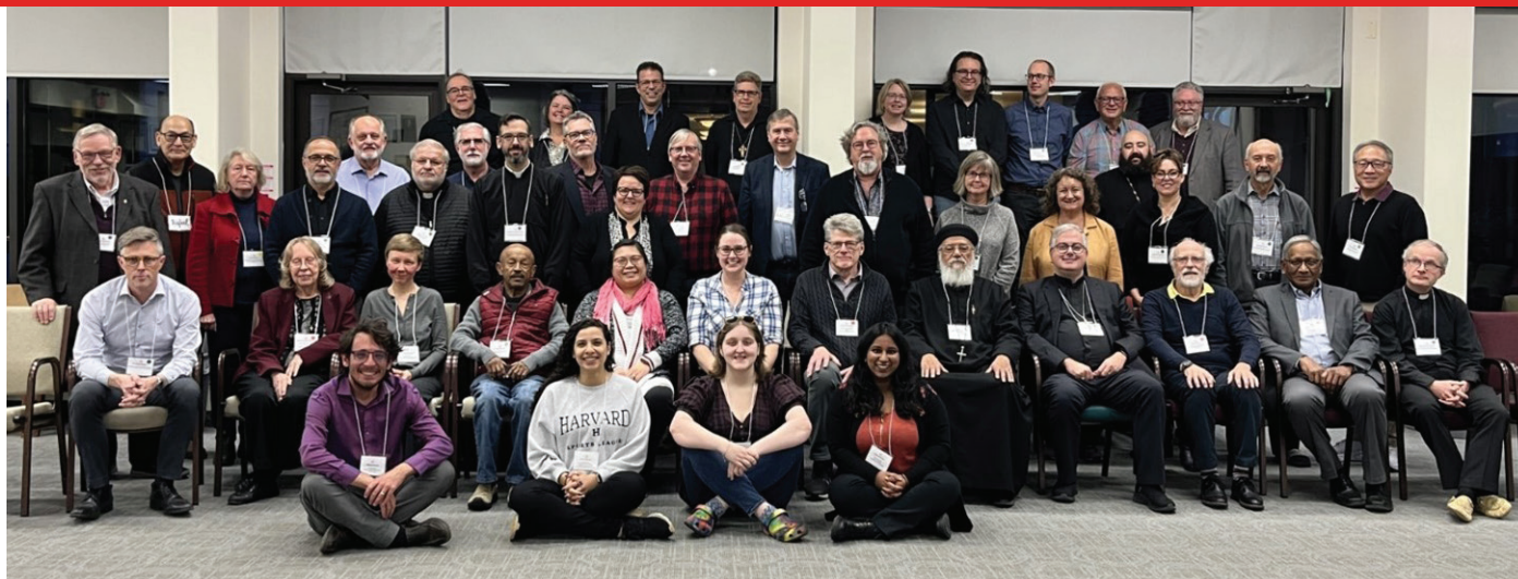
Membres et invités présents à la réunion du conseil de direction du CCE de novembre 2023, au Queen of Apostles Renewal Centre à Mississauga, en Ontario. | Members and guests in attendance of the Council's November 2023 Governing Board meeting at Queen of Apostles Renewal Centre in Mississauga, Ontario.