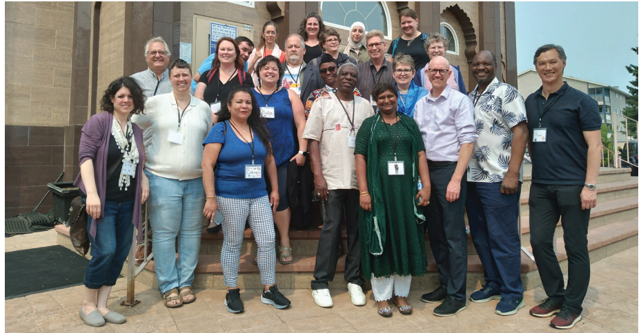
The July 2023 cohort of FILL's five-day DUIM program was held in Edmonton, Alberta. | La cohorte de juillet 2023 du programme Engagez la différence ! : cinq jours à Edmonton (Alberta) organisés par le Forum pour le leadership et l'apprentissage interculturels (FILL).

» Read more about this event on pp. 10-11 of this Report