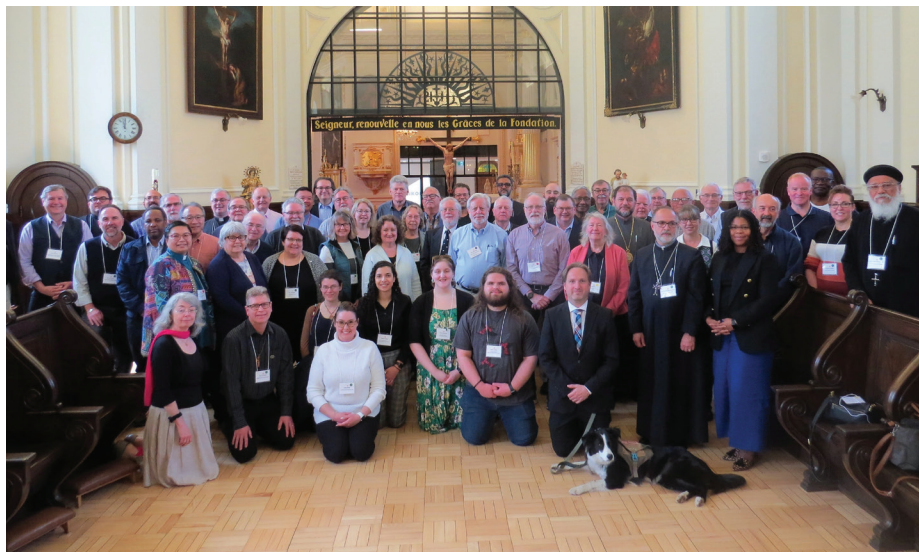
La cohorte de juillet 2023 du programme DUIM du Forum pour le leadership et l'apprentissage interculturels s'est réunie pendant cinq jours à Edmonton, en Alberta. | Members and guests in attendance at the Spring 2023 Governing Board meeting in Québec City.

Cette conférence de la Conversation interreligieuse canadienne visait à aborder les causes de la division au sein de notre société et à trouver des moyens de favoriser le dialogue, de promouvoir la justice et de trouver un terrain d'entente au sein de la société civile canadienne en réunissant des universitaires, des dirigeants communautaires et des chefs religieux. Le Conseil a contribué à parrainer cet événement.